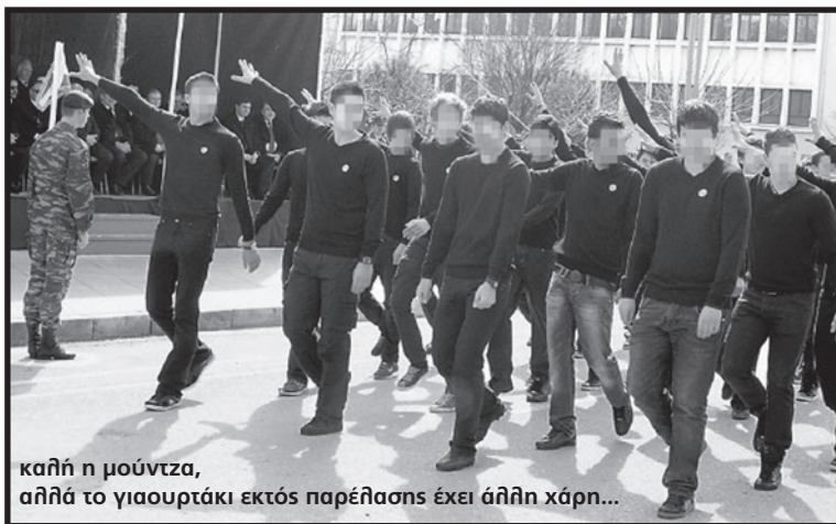
καλή η μούντζα, αλλά το γιαουρτάκι εκτός παρέλασης έχει άλλη χάρη...

Δηλαδή μια μούντζα -από μόνη της- προς τους πολιτικούς, συνιστά αντίδραση; Για αρχή συνιστά, αλλά -να μας συγχωράτε κιόλας- αν δεν έχει συνέχεια δε φτουράει και πολύ. Και τα λέμε αυτά εμείς, που ανήκουμε σε ένα πολιτικό χώρο που και σφαλιάρες έχει ρίξει σε πολιτικούς και χλέπες. Δηλαδή πριν 2 χρόνια οι πολιτικοί ήταν καλοί και δεν υπήρχε λόγος στην περυσινή παρέλαση για μούντζες; Δηλαδή οι μαθητές που κάνανε καταλήψεις το '91, το '98 και το '08 δεν αγωνιζότανε ενάντια στην πολιτική εξουσία που αναδιάρθρωσε το εκπαιδευτικό σύστημα; Το ίδιο πολιτικό σύστημα δεν είναι και τώρα, κι ας αλλάζουν (ελάχιστα) τα πρόσωπα; Τώρα γίνανε οι πολιτικοί άξιοι για μούντζες; Αυτό το πολιτικό σύστημα δεν ήτανε από γεννησιμιού του άξιο για φάσκελα, χλέπες, σαμποτάρισμα και ανατροπή; Μήπως ξεχνάει κανείς πως στην εξέδρα των επισήμων κάθονται και οι παπάδες; Αυτοί που πληρώνονται από τα κονδύλια του υπουργείου παιδείας, του ίδιου δηλαδή υπουργείου που καταγγέλουν οι μαθητές του 4ου Λυκείου; Ή μήπως ξεχνάμε πως πάνω στην εξέδρα κάθονται και οι ένστολοι των ενόπλων δυνάμεων που θα υποτάξουν τους νεολαίους στο χακί για 9 και 12 μήνες;