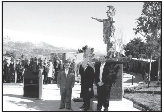
Σέρβος, Παπούλιας και Γκόντας αποκαλύπτουν το άγαλμα του μακεδάρη...

Τα αγάλματα των μεγάλων ανδρών φανερώνουν όμως και μια συγκεκριμένη αντίληψη της ιστορίας. Μια αντίληψη που θέλει την ιστορία να δημιουργείται από φωτεινές προσωπικότητες (αρσενικές στην πλειψηφία) και τις αποφάσεις τους. Μια αντίληψη ότι η κοινωνία είναι ο κομπάρσος, οι απώλειες κάτω από το σπαθί κάθε τυχαίου στρατιωτικού, οι χειροκροτητές στις αποφάσεις κάθε μεγάλου πολιτικού, το ποίμνιο κάθε ευλογημένου τραγόπαπα. Μια αντίληψη που έχει ανάγκη από άρχοντες, αφού αυτοί είναι που καθορίζουν τα πράγματα.