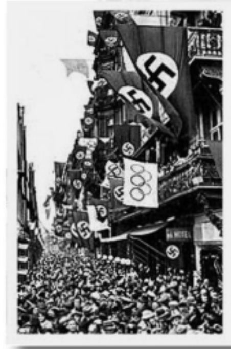
Πάνω: Ολυμπιακοί του Βερολίνου (1936)