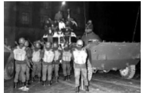
Κάτω: Ολυμπιακοί στην πόλη του Μεξικό (1968)