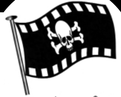
οι πειρατές των 8mm