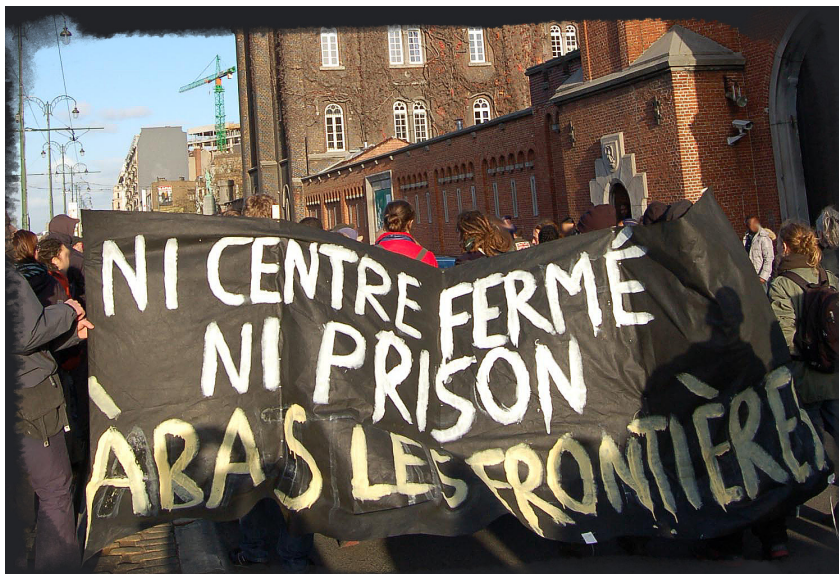
Πορεία αναρχικών στις Βρυξέλλες τον Νοέμβριο του 2009 ενάντια στα σύνορα και τα στρατόπεδα συγκέντρωσης.

σε ένα συγκεκριμένο χρονικό διάστημα είχαν δικαίωμα να προχωρήσουν σε αίτηση για νομιμοποίηση. Αυτή η διαδικασία έθεσε πολλούς ανθρώπους σε κατάσταση αναμονής, να παλεύουν με τη γραφειοκρατία και εξασθένησε τους συλλογικούς αγώνες, κυρίως επειδή και αυτοί οργανώνονταν γύρω από το συγκεκριμένο αίτημα. Καθώς η ενσωμάτωση συνοδεύεται και από την καταστολή, οι δυο πλευρές του ίδιου νομίσματος της λογικής του κράτους, οι απελάσεις συνέχισαν να αυξάνονται ακολουθώντας την στρατηγική του “τελευταίος μέσα-πρώτος έξω”. Οι αριστεροί υποχώρησαν περιμένοντας να κερδίσουν μελλοντική πολιτική υπεραξία, την ίδια στιγμή που εκατοντάδες μετανάστες (κυρίως όσοι δεν πρόλαβαν να κάνουν αίτηση και Ρομά) καταλάμβαναν το ένα κτίριο μετά το άλλο στην προσπάθειά τους να βρουν ένα μέρος για κατάλυμα και διώκονταν βάρβαρα και υφίσταντο εξώσεις από τους μπάτσους.