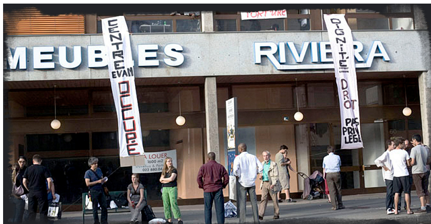
Κατάληψη του Κέντρου Επείγουσας Βοήθειας στο Vevey την άνοιξη του 2009.

νούς” και “οικονομικούς/πλαστούς” πρόσφυγες, το κράτος είναι σε θέση να διατηρεί την εικόνα της ελβετίας ως μιας ανθρωπιστικής χώρας, η οποία χορηγεί άσυλο σε αυτούς που βρίσκονται σε κίνδυνο, ενώ την ίδια στιγμή είναι νομιμοποιημένη όταν απορρίπτει άλλους αιτούντες άσυλο και τους εκθέτει στην καταστολή 6 . Όσα άτομα έχουν λάβει απορριπτική απάντηση στην αίτηση ασύλου, έρχονται αντιμέτωπα με εξαναγκαστικά μέτρα που στοχεύουν στην «εξασφάλιση της εκτέλεσης της απέλασης» (μέχρι και 24 μήνες “διοικητική” κράτηση εν αναμονή απέλασης και εξαναγκαστικά μέτρα κατά τη διάρκεια της απέλασης, που συμβαίνουν σε «ειδικές» πτήσεις). Ωστόσο, ο στόχος του κράτους δεν είναι να απελάσει όλους τους απορριφθέντες αιτούντες άσυλο. Οι απελάσεις κοστίζουν ακριβά και ρισκάρουν να αμαυρώσουν την ανθρωπιστική εικόνα της Ελβετίας. Κυρίως, εξυπηρετούν τη λειτουργία της τρομοκράτησης των ατόμων, τα οποία είναι πιο πιθανό να εξωθηθούν στην παρανομία παρά να απελαθούν.