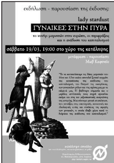
μάρτης 2011: εκδήλωση - παρουσίαση της έκδοσης "Γυναίκες στην πυρά" από το ΜΩΒ ΚΑΦΕΝΕΙΟ