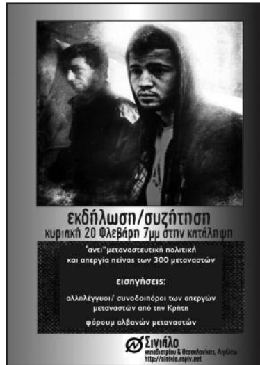
φλεβάρης 2011: εκδήλωση για την "αντι" μεταναστευτική πολιτική και απεργία πείνας των 300 μεταναστών