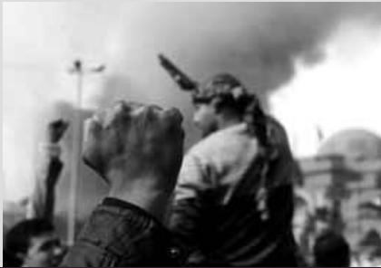
My class, my pride.