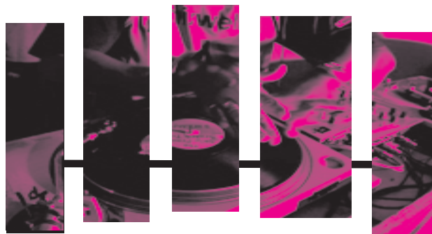
(Στο επόμενο τεύχος: Στιγμές από το hip hop στην Ελλάδα)