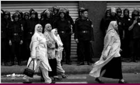
Υπερήφανες γυναίκες περνάνε μπροστά από τους μπάτσους.