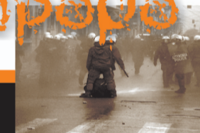
Συντονισμένη επίθεση των ΜΑΤ στην πορεία. Συνολικά 8 συλλήψεις.

ΕΚΔΗΛΩΣΗ-ΣΥΖΗΤΗΣΗ για τα γεγονότα της Νίκαιας (με προβολή εισηγητικού βίντεο)