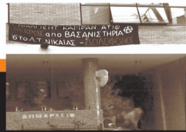
17-18/10. Διήμερη κατάληψη του Δημαρχείου Νίκαιας μετά την πορεία. 5 από τους συλληφθέντες κατηγορούνται με τον «κουκουλονόμο» για κακούρημα.

Παρασκευή 27 Νοέμβρη, 6:00 μμ στο Δημαρχείο της Νίκαιας