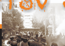
Βροχή από πέτρες στη διμοιρία προστασίας του αστυνομικού τμήματος. Συντεταγμένη αποχώρηση.