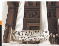
19-22/10. Κατάληψη της Πρυτανείας του Πανεπιστημίου Αθηνών και άλλων χώρων πανελλαδικά για αλληλεγγύη. Οι καταλήψεις λήγουν στις 22/10, με την απελευθέρωση και των τελευταίων συλληφθέντων.