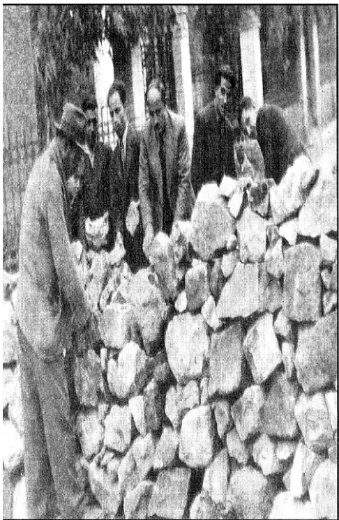
εκτός από τους αντάρτες, χιλιάδες άλλοι άνθρωποι πήραν μέρος στην εξέγερση του Δεκέμβρη, βοηθώντας όπως μπορούσαν.

Ξημερώνει λοιπόν η Τετάρτη 6 Δεκεμβρίου. Οι άγγλοι μπαίνουν για τα καλά στη μάχη, χρησιμοποιώντας όλα τα σύγχρονα μέσα που διέθετε ο στρατός τους. Εξαπολύουν ισχυρότατη επίθεση στην Καισαριανή (το μικρό Στάλινγκραντ) και