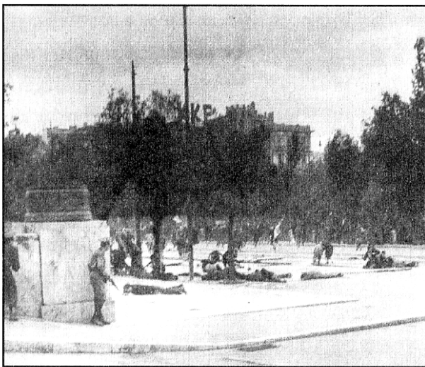
και ξαφνικά ακούγονται πυροβολισμοί, η αστυνομία χτυπά τους συγκεντρωμένους.

Το πλήθος μετά το πρώτο σοκ δε διαλύεται, ανασυντάσσεται σηκώνει τους νεκρούς του και τραγουδάει το πένθιμο εμβατήριο του ΕΛΑΣ “επέσατε θύματα αδέρφια εσείς”. “Ο στρατιωτικός ακόλουθος της αμερικάνικης πρεσβείας Μανκίλ έγραψε: Γύρω από το σημείο της ασφάλτου, όπου είχαν σφαγιασθεί οι σύντροφοί τους, σχηματίστηκαν μικροί όχθοι από λουλουδία και κλαδιά ενώ εκατοντάδες από τους διαδηλωτές έσκυβαν να βουτήξουν το μαντήλι τους μέσα στο νωπό αίμα που λίμναζε στο κατάρσρωμα του δρόμου. Και τα μαντήλια αυτά όσοι τα κρατούσαν γίνονταν σημαίες, που τις περνούσαν μέσα από τα πλήθη καλώντας όλους τους γύρω τους να αγγίξουν το ματοβαμμένο πανί και να ορκιστούν εκδίκηση εναντίον εκείνων που προκάλεσαν τη σφαγή” 14 . Απολογισμός, περίπου 30 νεκροί και πάνω από εκατό τραυματίες. Οι περισσότεροι νοσηλεύτηκαν στο νοσοκομείο “Αγία Όλγα” στη Νέα Ιωνία. Το νοσοκομείο πυροβολούταν όλη τη νύχτα από τα αγγλέζικα αεροπλάνα. Ασταμάτητα!