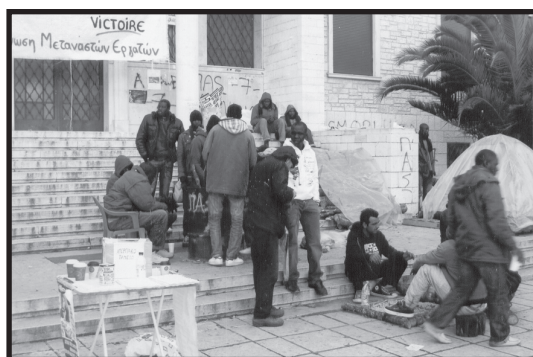
απεργία πείνας μεταναστών εργατών γης, για την καταβολή δεδουλευμένων, μπροστά από τη Νομαρχία Ιωαννίνων, Δεκέμβρης 2010