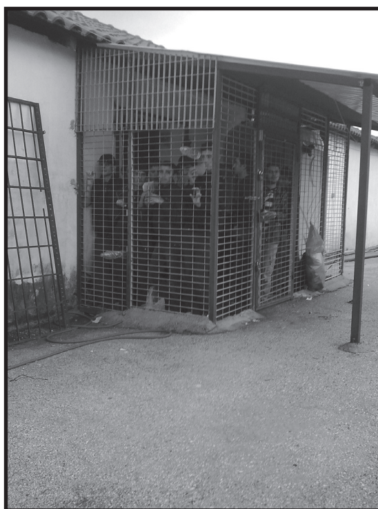
κρατητήρια μεταναστών εντός του λιμανιού Ηγουμενίτσας