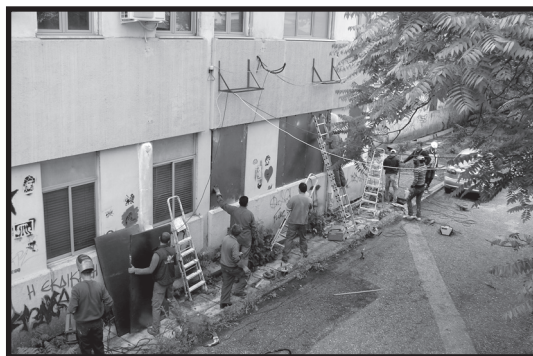
συνεργεία λαμαρινάδων και μπογιατζήδων (υπό την προστασία δεκάδων μπάσων) σφραγίζουν τα κατειλημμένα σπίτια μεταναστών, ύστερα από εντολή του ιδιοκτήτη τους, του νοσοκομείου Χατζηκώστα Ιωαννίνων, 26-05-2012