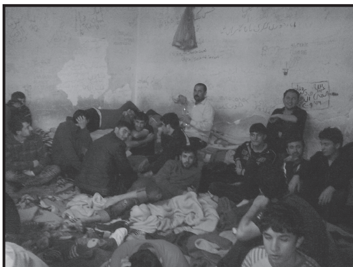
κρατητήρια μεταναστών εντός του λιμανιού Ηγουμενίτσας