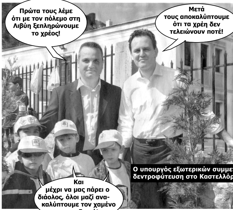
Ο υπουργός εξωτερικών συμμετέχει σε δέντροφύτευση στο Καστελλόριζο, 29/3/2011