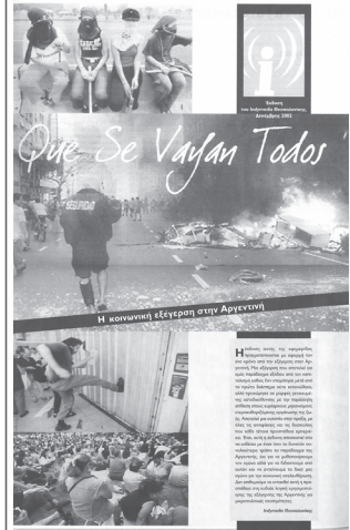
Que Se Vayan Todos: εφημερίδα για την κοινωνική εξέγερση στην Αργεντινή (έκδοση δεκέμβριος 2002)

μετά τον Ιούνιο του 2003, η συνέλευση ατόνησε με αποτέλεσμα η ενημέρωση της σελίδας να γίνεται εργαλειακά και πρωτοβουλιακά και όχι συλλογικά.