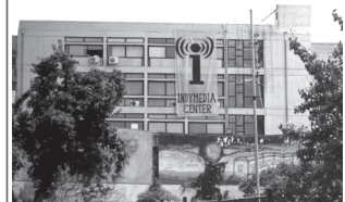
το κατειλημμένο κτήριο της νομικής: Κοινωνικό Ανεξάρτητο Κέντρο Ενημέρωσης

Ήταν η πρώτη φορά σε παγκόσμιο ραντεβού που το IMC στήθηκε από ντόπιους, σε δικό του χώρο, με όρους λειτουργίας καθαρά αντιεξουσιαστικούς.