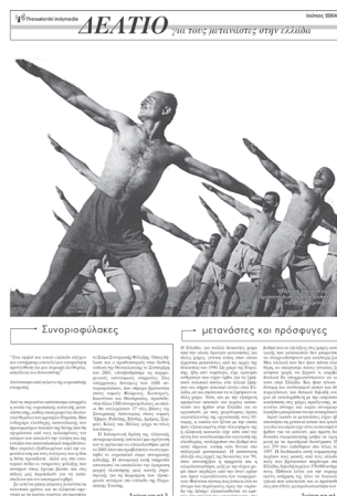
δελτίο για τους μετανάστες (έκδοση: Ιούνιος 2004)

Θα θέλαμε η επίσκεψη στο imc thessaloniki να ήταν μια συνειδητή πολιτική κίνηση και όχι ένα εναλλακτικό σερφάρισμα που γεμίζει απλώς τις μοναχικές χειμωνιάτικες νύχτες