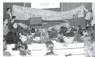
παρέμβαση στα πανεπιστήμια μα νοέμβριος 2001

η ίδρυση του indymedia thessaloniki ήταν κυρίως η απάντηση στην ανάγκη για δημιουργία μιας σταθερής δομής αντιπληροφόρησης