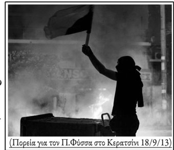
(Πορεία για τον Π.Φύσσα στο Κερατσίνι 18/9/13)

Πέρα από τις πρώτες ώρες, που στον πανικό προσπάθησαν να μιλήσουν για οπαδιό/απολίτιο ζήτημα, φάνηκε πως αυτή η είδηση δεν μπορούσε ούτε να θαφτεί ούτε να αλλοιωθεί σημαντικά. Οπότε το κύκλωμα αλληλοεξυπηρέτησης δημοσιογράφων-πολιτικών-μπάτσων έπρεπε να μαζέψουν κάποια πράγματα, χωρίς όμως να θιγεί η αξιοπρέπεια της Δημοκρατίας, η καλή πρόθεση του ελληνικού λαού κλπ.