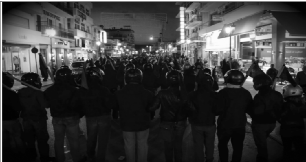
(Αντιφασιστική πορεία, Βόλος 05/10/13)

νεκρών νεοναζί, ότι δηλαδή θα ήταν πιο αποτελεσματικό αν εκτελούσαν υψηλόβαθμα στελέχη της χρυσής αυγής, παρά τα αναλώσιμα της. Τα οποία όμως δεν ήταν απλά μέλη αλλά στελέχωναν τα δολοφονικά τάγματα εφόδου που άπειρες φορές είχαν επιτεθεί σε αγωνιστές/τριες, είχαν σακατέψει και δολοφονήσει μετανάστες με τις ενέδρες και τις εισβολές σε σπίτια, σκορπούσαν την τρομοκρατία και δεν είχαν πρόβλημα να την προπαγανδίζουν, για αυτό άλλωστε σε τέτοιες ενέργειες φρόντιζαν να φέρουν τα διακριτικά του κόμματός τους. Έτσι λοιπόν η εκτέλεση των φασιστών πέρασε το μήνυμα και στα χαμηλά κλιμάκια της χρυσής αυγής ότι κανένας δεν είναι στο απυρόβλητο, με την δικαιολογία των αναλώσιμων. Όσο σημαντικό είναι να χτυπάς τους εγκεφάλους και την ηγεσία τέτοιων συμμοριών, άλλο τόσο είναι και η επίθεση στα εκτελεστικά κομμάτια που αναλαμβάνουν να κάνουν τη βρώμικη δουλειά.