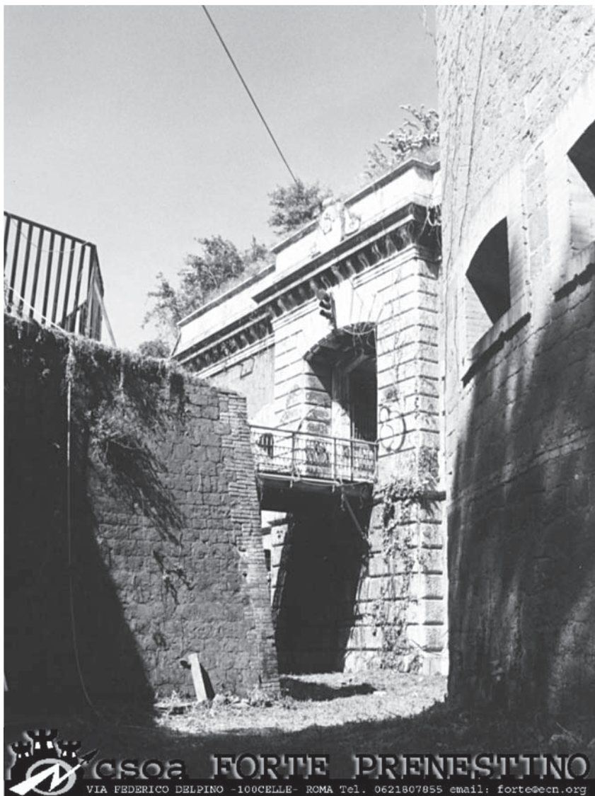
Η είσοδος και η περιμετρική τάφρος του κοινωνικού κέντρου c.s.o.a. Forte Prenestino στη Ρώμη