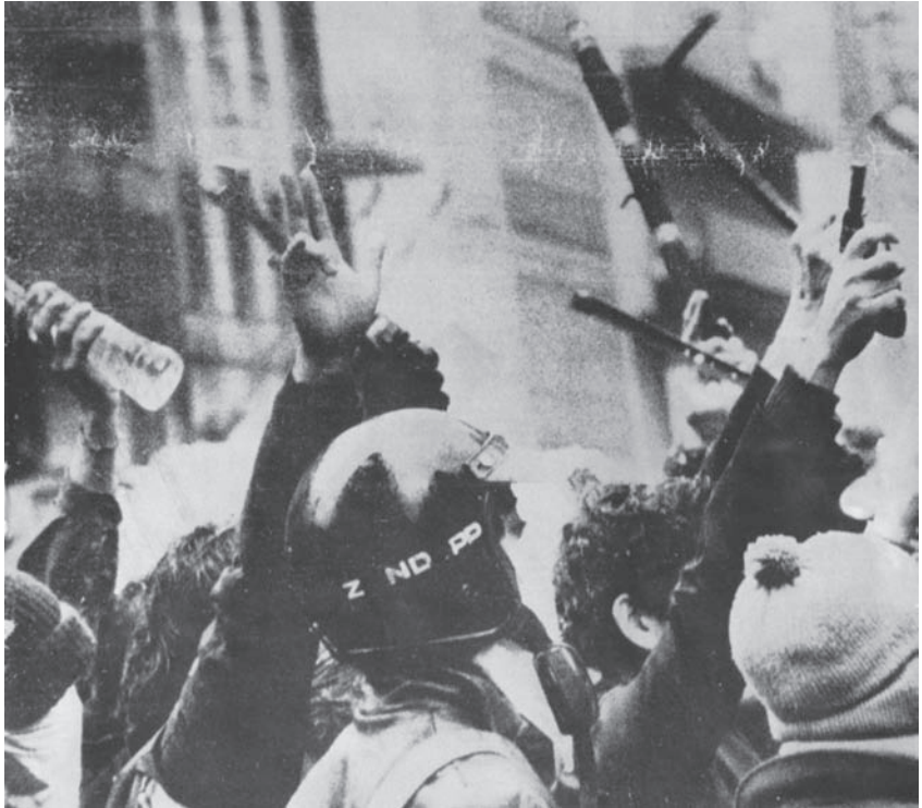
Πορεία αυτόνομων τη δεκαετία του '70 στην Ιταλία