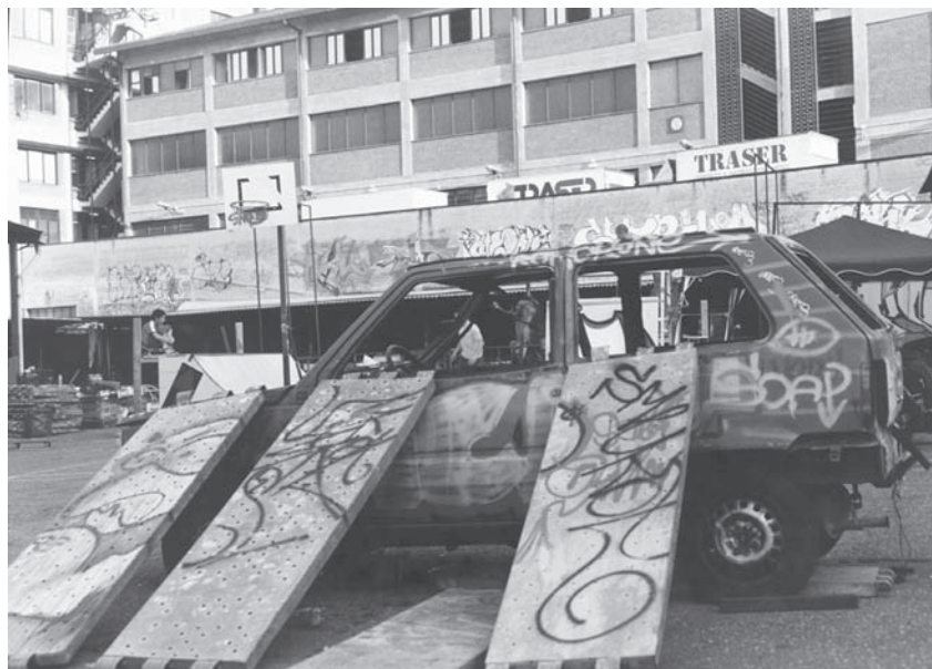
Απόγευμα στο κατειλημμένο από το 2003 αυτοδιαχειριζόμενο κοινωνικό κέντρο c.s.o.a. STRIKE στη περιοχή Tiburtina της Ρώμης