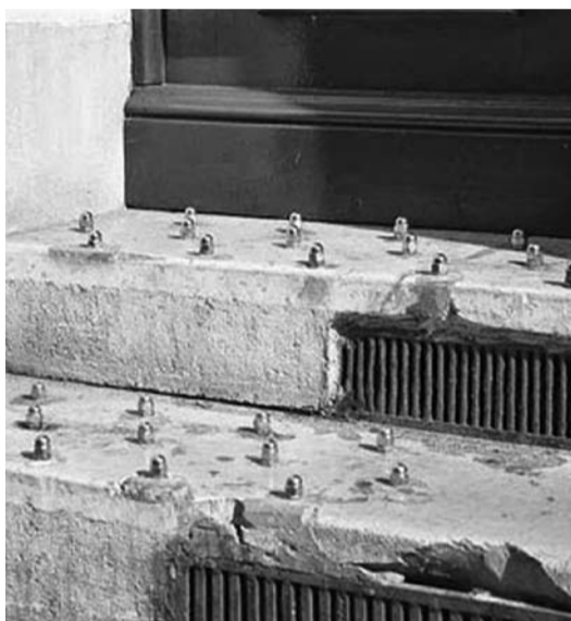
Πρόστιμα, σκηνές αντί για σπίτια και σκαλοπάτια με καρφιά.

Η Ana Botella, δήμαρχος της Μαδρίτης, αποφάσισε να ποινικοποιήσει την φτώχεια και να επιβάλλει «συνταγματικό σαδισμό» σε χιλιάδες ανθρώπους που δεν έχουν τίποτα. Ετοιμάζει ένα σχέδιο νόμου που θα επιφέρει κυρώσεις στους ανθρώπους που είναι αναγκασμένοι να ζουν στον δρόμο, να ζητιανεύουν ή να πλένουν παρμπρίζ αυτοκινήτων για να επιβιώσουν.