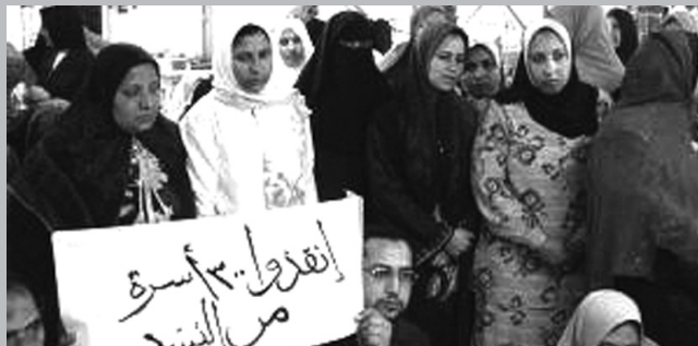
Εργάτες και εργάτριες ιματισμού στο εργοστάσιο Μανσούλα - Εσπάνια στην Τάλκα της Αιγύπτου, σε απεργία που κράτησε δυο μήνες ενάντια σε μπάτσους και παρακρατικούς.

Και για να ξεμπερδεύουμε: οι εξεγέρσεις στη Μέση Ανατολή και τη Βόρεια Αφρική ήταν αναγκασμένες να αντιπαρατεθούν με τον συλλογικό δυτικό νου που πάνω στο σκάρτο πρόταγμα της "αντιτρομοκρατίας" έχει εδώ και δεκαετίες δικαιολογήσει την πολυμέτρη επίθεση στο μουσουλμανικό προλεταριάτο παγκοσμίως: στο Ιράκ, στο Αφγανιστάν, στην Παλαιστίνη, στο εσωτερικό -μην το ξεχνάτε- των δυτικών κοινωνιών που οι μουσουλμάνοι προλετάριοι σαν μετανάστες εργάτες αιμοδοτούν μια κοινωνία σε αποσύνθεση. Δεν είμαστε από αυτούς που βλέπουν θριάμβους εκεί που δεν υπάρχουν. Υπάρχει, ωστόσο, τουλάχιστον μια νίκη που αν και πρόσκαιρη είναι αδιαμφισβήτητη: η κατάρριψη των αντιμουσουλμανικών στερεοτύπων από το ίδιο το μουσουλμανικό προλεταριάτο και η υπενθύμιση πως σε Ευρώπη, Αφρική και Ασία όλα τα γουρούνια την ίδια μούρη έχουν.