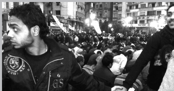
Χριστιανοί προστατεύουν μουσουλμάνους την ώρα που προσεύχονται. Πλατεία Ταχρίρ, Κάιρο.