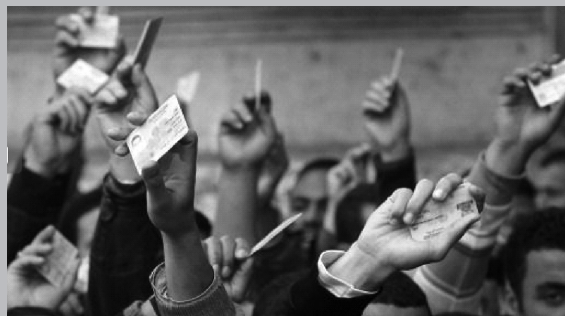
Οι ταυτότητες που απέσπασαν οι εξεγερμένοι Αιγύπτιοι από παρακρατικούς και ασφαλίτες, όταν οι τελευταίοι προσπάθησαν να προσεγγίσουν την πλατεία Ταχρίρ.