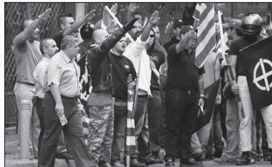
Ο Μιχαολιάκος με βουλευτές και μέλη του κόμματός του

Η άνοδος της ακροδεξιάς αποτελεί μια μεταβλητή στην εξίσωση του γενικευμένου κοινωνικού πολέμου που μαίνεται γύρω μας. Η - αρχικά - οικονομική κρίση, με γοργούς ρυθμούς μετατράπηκε σε συνολική πολιτική, κοινωνική