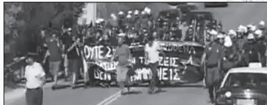
2.9.2012 Αντιφασιστική παρέμβαση στο Χορτιάτη

Στις 2.9.2012 ο δήμαρχος Χορτιάτη είχε επιλέξει να προσκαλέσει και μέλη της χρυσής αυγής μαζί με τα υπόλοιπα πολιτικά κόμματα, στην εκδήλωση μνήμης για τα θύματα της μαζικής εκτέλεσης κατοίκων από ταγματασφαλίτες υπό τις εντολές των ναζί. Ο δήμαρχος επέμεινε στην αρχική του αυτή απόφαση παρά τις έντονες διαμαρτυρίες και τις διαρκείς αντιδράσεις των κατοίκων της περιοχής. Ορμώμενοι από το γεγονός αυτό και τελείως αντανάκλαστικά επιλέξαμε να παρέμβουμε θέλοντας να αποτρέψουμε την παρουσία των χρυσαυγιτών. Καθοριστικός λόγος της παρουσίας μας στάθηκε το οξύμωρο της παρουσίας ανθρώπων με ανοιχτά φασιστικές καταβολές σε μία συγκέντρωση με αντιναζιστικά χαρακτηριστικά. Παρά την αρχική παρεμπόδισή μας από αστυνομικές δυνάμεις, καταφέραμε να προσεγγίσουμε το σημείο συγκέντρωσης και η παρουσία των φασιστών απειράπη.