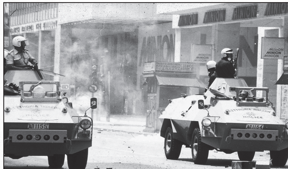
Οι αύρες του Καραμανλή επί τω έργω

Το νέο δημοκρατικό καθεστώς, από τη μία κλείνει τα στρατόπεδα συγκέντρωσης και οι εξόριστοι γυρνάνε στους τόπους τους, αλλά συγχρόνως αφήνει ανέγγιχτο τον εκτελεστικό κορμό του κουντικού κράτους (ΕΑΤ-ΕΣΑ, βασανιστές, μπάτσους, στρατιωτικούς κ.α.). Οι μόνοι που πέρασαν από δίκη