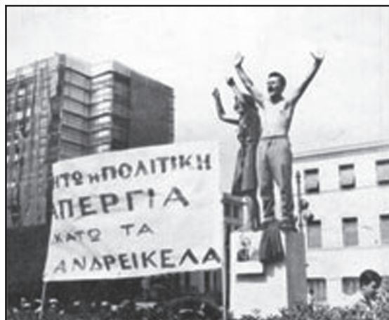
Γενική πολιτική απεργία 27.7.1965

29.7.65: Συνεδριάζει η κοινοβουλευτική ομάδα της Ένωσης Κέντρου. 143 βουλευτές υπογράφουν πρωτόκολλο καταδίκης των προδοτών του Κέντρου, όπως τους αποκαλούν.