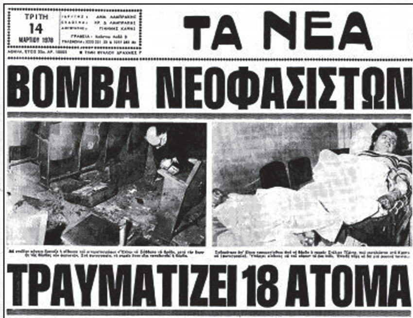
Τα Νέα της 14ης Μάρτη 1978 για τις βομβιστικές επιθέσεις στα σινεμά «Ρεξ» και «Ελλη»

Το 1980 ο Ν. Μιχαλολιάκος ιδρύει τον Λαϊκό Σύνδεσμο που εκδίδει το περιοδικό «Χρυσή Αυγή» με ξεκάθαρα ναζιστική κατεύθυνση, ενώ το 1984 διορίστηκε από τον έγκλειστο δικτάτορα και ιδρυτή της «Εθνικής Πολιτικής Ένωσης» (ΕΠΕΝ), Γ. Παπαδόπουλο, πρόεδρος νεολαίας του κόμματος, το οποίο έχει σχέσεις και με την ευρωπαϊκή ακροδεξιά (συνέδριο Ευρωπαϊκής Δεξιάς στην Αθήνα παρουσία του Λεπέν και άλλων ευρωπαίων εθνικιστών το 1984). Επόμενος πρόεδρος νεολαίας της ΕΠΕΝ είναι ο Μ. Βορίδης, προερχόμενος από την «δεξιά στροφή» της ΟΝΝΕΔ του 1982 (με πρόεδρο νεολαίας τον Β. Μιχαλολιάκο), με γνωστή παρακρατική δράση. Το 1994 ιδρύει με μέλη του διαλυμένου ΕΝΕΚ και της ΕΠΕΝ (που διαλύεται οριστικά το 1996) το «Ελληνικό Μέτωπο».