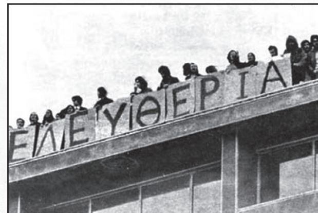
Κατάληψη Νομικής 1973

Το φοιτητικό κίνημα κορυφώνεται στην εξέγερση του Νοέμβρη 1973, και ενώ ήδη το καθεστώς προσπάθησε