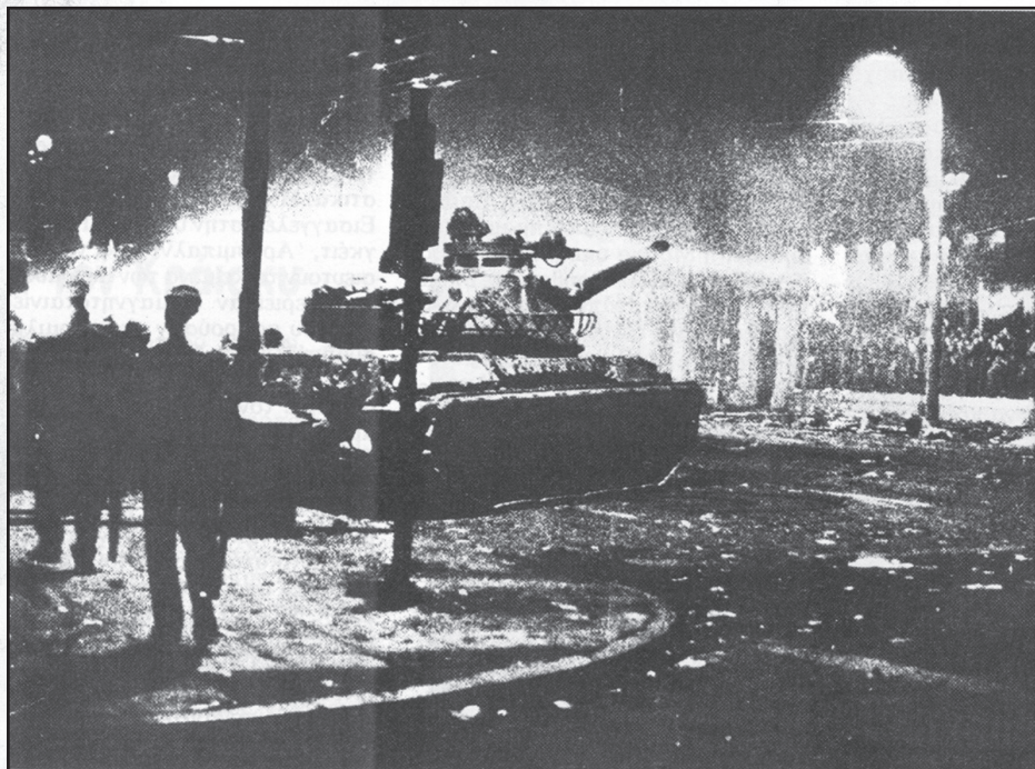
17 Νοέμβρη 1973: καταστολή της εξέγερσης του πολυτεχνείου με δεκάδες νεκρούς και εκατοντάδες τραυματίες

τον Παπαδόπουλο κηρύσσοντας εκ νέου τον στρατιωτικό νόμο, καταγγέλλοντας “προδοσία της επανάστασης” από την κυβέρνηση Μαρκεζίνη-Παπαδόπουλου.