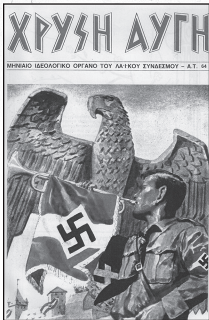
Το 64ο τεύχος της χρυσής αυγής