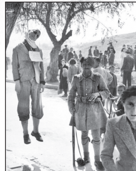
Ταγματσαφάλης ποζάρει δίπλα στο θύμα του

Μια σειρά ομάδων και οργανώσεων δημιουργούνται κατά τη διάρκεια της κατοχής και του εμφυλίου με κοινή αφετηρία την εθνοφοροσύνη και τον αντικομμουνισμό. Πολύ λίγες από αυτές μπορεί αρχικά να έδρασαν κατά των ναζί, αλλά γρήγορα θα στρέψουν την προσοχή τους και τα πυρά τους κατά του ΕΑΜ-ΕΛΑΣ και των μη εθνικιστών ανταρτών. Στον παρακάτω πίνακα αποτυπώνονται οι εθνικιστικές οργανώσεις που παίζανε πιο ενεργό ρόλο κατά την διάρκεια της κατοχής και του εμφυλίου. Από αυτές θα αναδυθεί η ακροδεξιά και το παρακράτος της περιόδου 1949-1967, ο ΙΔΕΑ και η χούντα των συνταγματαρχών.