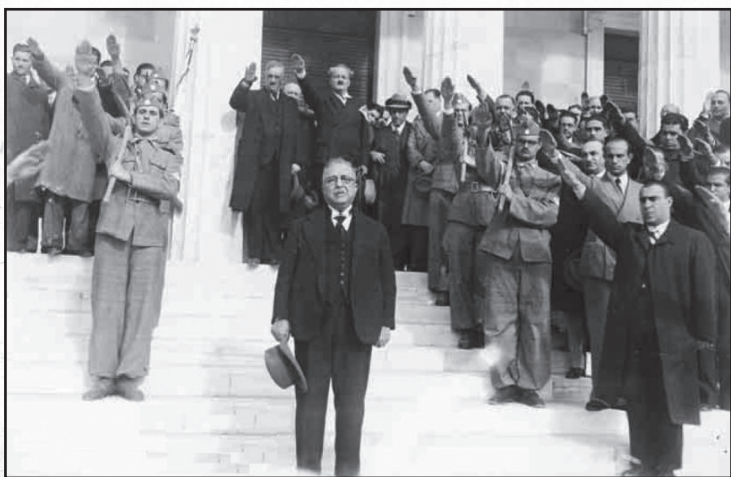
Ο Μεταξάς με φόντο τον “Γ’ Ελληνικό Πολιτισμό” του

Μέχρι την δικτατορία του Μεταξά στην ελληνική κοινωνία κυριαρχούσε το δίπολο “βενιζελικοί-αντιβενιζελικοί”. Με την επικράτηση του Μεταξά αυτή η πόλωση αρχίζει να μετατοπίζεται και κατασταλάζει με τον εμφύλιο στο νέο δίπολο “κομμουνιστές-εθνικόφρονες”.