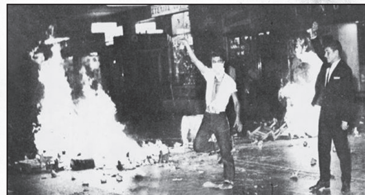
20.8.1965: Πύρινα οδοφράγματα στο κέντρο της Αθήνας

20.8.65: Ορκίζεται η κυβέρνηση Τσιριμώκου. Αυθόρμητα στήνονται πύρινα οδοφράγματα σε όλο το κέντρο της Αθήνας. 150 τραυματίες, 226 συλληφθέντες.