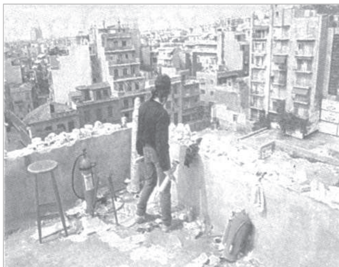
1985 - Το Χημείο οχυρώνεται από τους καταληψίες του