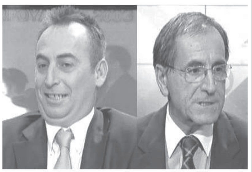
Εκπομπή του ΜΕΓΑ για το Άσυλο μετά το τελεσίγραφο του Κράτους για την επικείμενη κατάργησή του: Οι αδέκαστοι ειδικοί επί παντός επιστητού επί τω έργω.

και βάση πλάνου τους χώρους ασύλου επιδιώκοντας να έχει συνεχή φυσική παρουσία και λόγο στον τρόπο λειτουργίας τους είτε με την διαρκή παρουσία αστυνομικών δυνάμεων και καμερών είτε με την τοποθέτηση συμβόλων του (Υπουργείο Τύπου, Στρατόπεδο ΜΑΤ, ΑΤ Ζωγράφου, κτλ). Με τη συστράτευση Τύπου – Κράτους να έχει φτάσει σε Μεταξικά επίπεδα, τουλάχιστον όσον αφορά αυτό το ζήτημα, έχουμε πλήρως κατευθυνόμενα δημοσιεύματα σε επιλεγμένες χρονικές περιόδους με «πηγές» είτε από την Ασφάλεια είτε από πανεπιστημιακούς και στόχο την δαιμονοποίηση του ασύλου στην